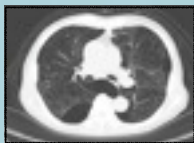
COPD (慢性閉塞性肺疾患)