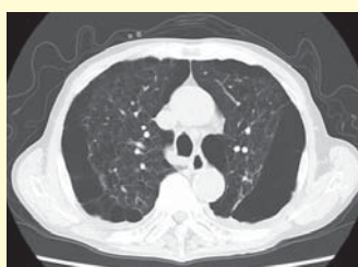
▲COPD(慢性閉塞性肺疾患)